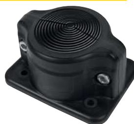
MC 1x8-67 (IP55)