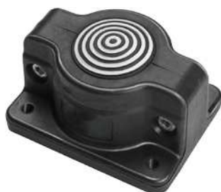
SCG 1x3-35 (IP55)