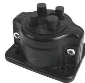
MC 1/9 (IP55)